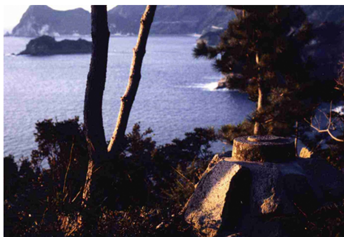
資料4 方角石より海上を望む

【資料1】は江戸時代の大坂・江戸間の航路を描いたものです。伊豆半島先端から志摩半島の鳥羽・大湊等に直行する当時のメインルートが確認できます。（「浦方略絵図」妻良区有文書（南伊豆町）歴史文化情報センター請求番号：24014-近世写真集51-k001s）