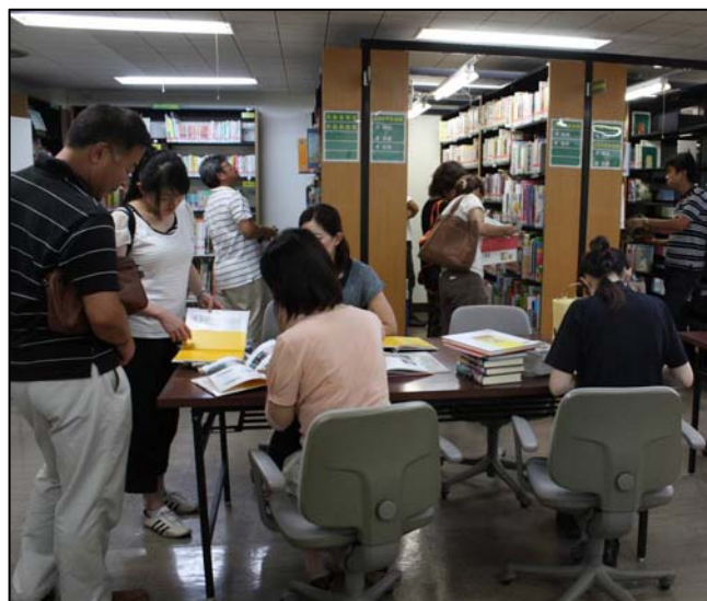
先生方による選書風景

子ども図書研究室では団体利用も受け付けています。グループでの選書などにご利用ください。学校図書館で購入する図書を各学年の先生方で選んだり、図鑑や百科事典など実際に手に取って内容を見比べたりすることができます。ご希望があれば担当職員が図書に関するご相談にも応じます。