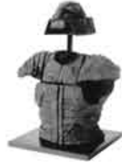
〈写真2〉鉄製の甲冑（五ヶ山B 2号墳）

『静岡県史』通史編1 原始・古代、別編3 図説静岡県史 静岡県教育委員会『静岡県の前方後円墳』 静岡県埋蔵文化財調査研究所『遺跡調査報告会資料』（2006）、『原分古墳』