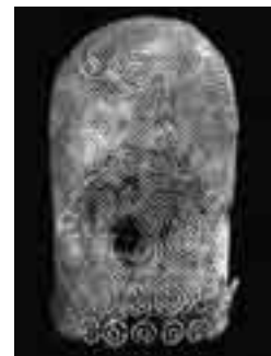
〈写真4〉大刀の模様（原分古墳）