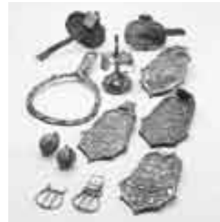
〈写真3〉装飾馬具（賤機山古墳）