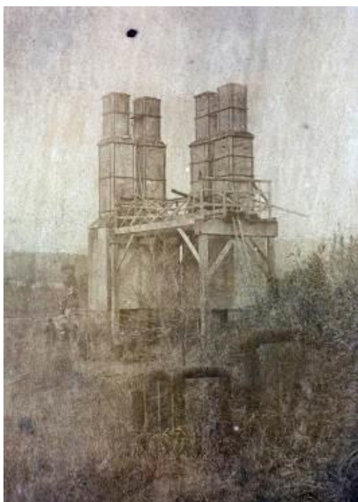
明治初期の韮山反射炉

韮山反射炉は、今年7月8日に世界遺産登録から3周年を迎えます。 今回の企画展では、韮山反射炉の価値や歴史、さらに、国内8県11市に分布する「明治日本の産業革命遺産」の構成資産について、パネルや映像で紹介します。