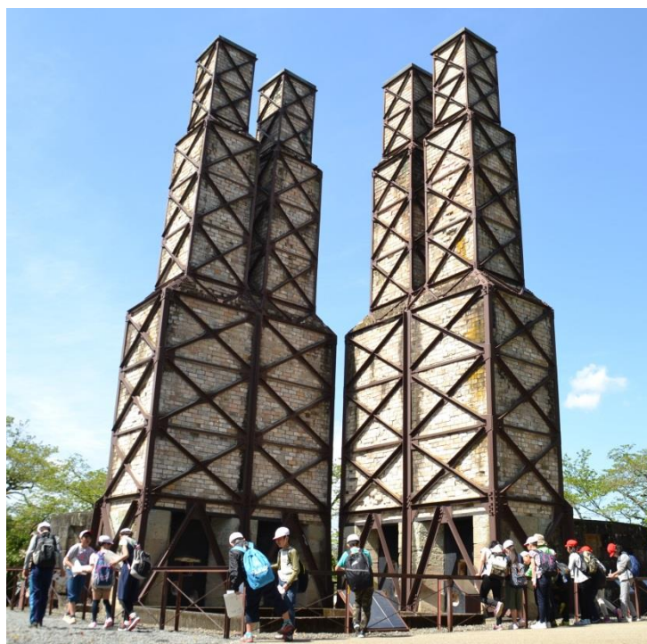
現在の韮山反射炉