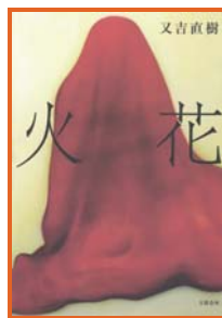
又吉直樹 著『火花』 文芸春秋

第155回芥川賞を受賞した村田沙耶香(むらた・さやか)氏の小説『コンビニ人間』も担当した。