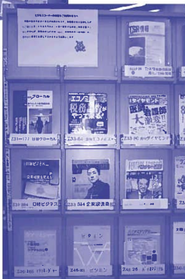
ビジネスコーナー 雑誌棚