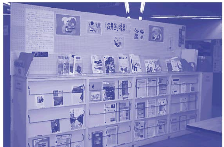
レファレンスサービスカウンター横 特集展示5月「お弁当特集」