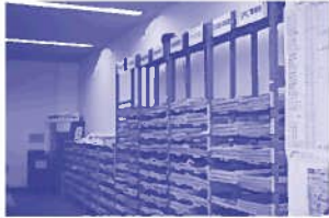
総合案内カウンター横 新聞コーナー

県立中央図書館では、42タイトルの新聞を所蔵しています。『静岡新聞』、『朝日新聞』から、海外の新聞、『電気新聞』など聞き慣れないものまで、いろいろな種類の新聞を取り揃えています。これらの新聞は、原紙、縮刷版、マイクロフィルム等で所蔵しており、『毎日新聞』についてはマイクロフィルムで明治5年の古い新聞をご覧いただけます。