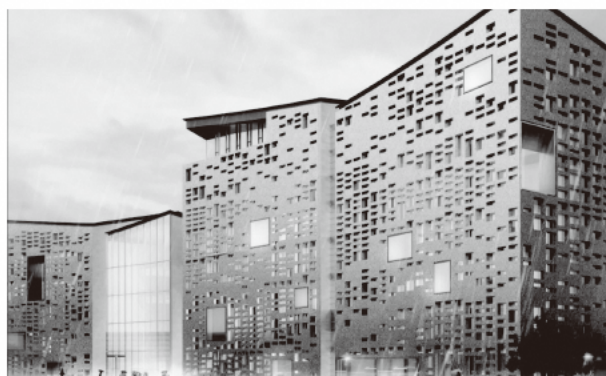
浙江図書館 新館構想図

新館の総面積は 8.5 万平方メートルで、地上 5.9 万平方メートル、地下 2.6 万平方メートル（地下2階）になります。