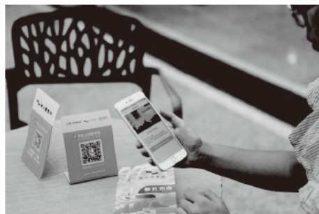
二次元コードを通じて、スマートフォンで図書館APPダウンロードや図書館サービスが利用可能

新館の総面積は 8.5 万平方メートルで、地上 5.9 万平方メートル、地下 2.6 万平方メートル（地下2階）になります。