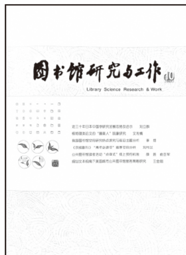
浙江図書館刊行物 「図書館研究和工作」 (ISSN CN33-1398/G2)

2018 年 4 月に登場した「信閲」サービスは、個人信用をもとに読書サービスを提供するものです。第三者信用機関で 550 ポイントに達する省内の読者は、オンラインで借り入れ機能を開き、図書館に無い本を購入して、借りることができます。図書館と連携関係を持つ出版社は、リクエストされた新書を直接読者の住所まで宅配便によって届けることを担当します。書籍費用と宅配料は図書館と出版社それぞれ負担することになっています。返却の場合、持参の形で