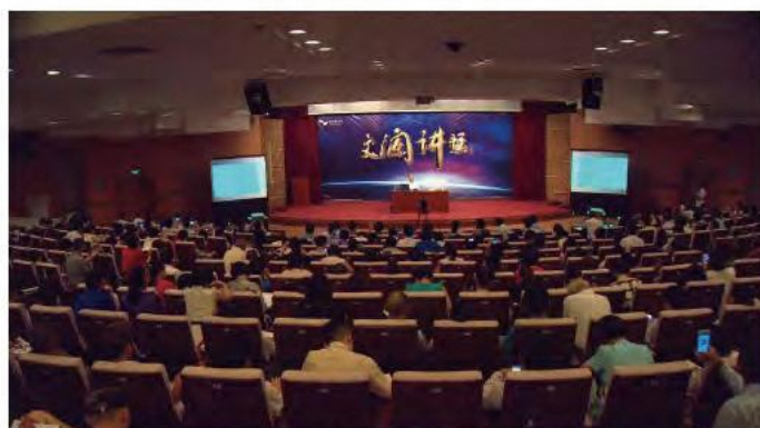
「文瀾説教壇」イベント