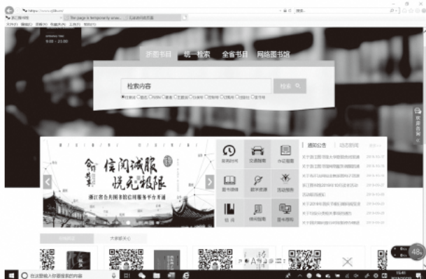
浙江図書館ウェブサイト本ページで掲載されている「信閲サービス」情報

浙江図書館が先頭に立って、省内 11 の市立図書館と3つの児童図書館を集結し、省全体を一つの形で、第三者信用サービス機関と連携し、「信閲」サービスを打ち出しました。