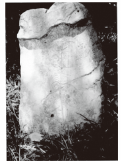
写真：宝永地震犠牲者供養塔

供養塔は白鳥山の崩落地を真正面に望む位置（八幡社近く）にあり、被害を忘れてはならないというメッセージが込められているように思えます。私たちは先人が遺したメッセージを受け取り、後世に伝えていく必要があるでしょう。