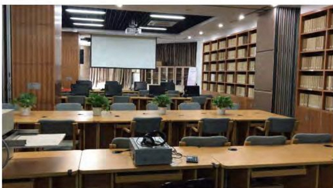
浙江図書館 視覚障害者センター