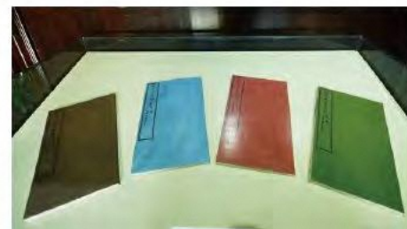
特色コレクション 文瀾閣「四庫全書」