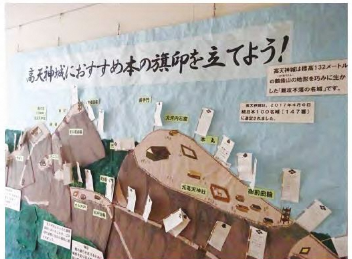
2019.6.5 掛川市立大東図書館