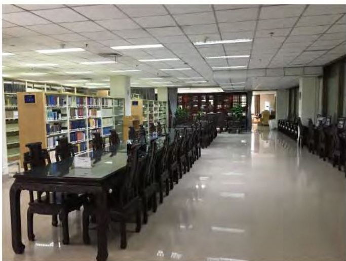
浙江図書館 古書センター