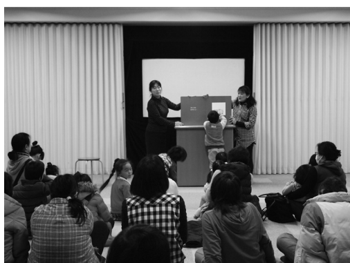
おはなしポケット