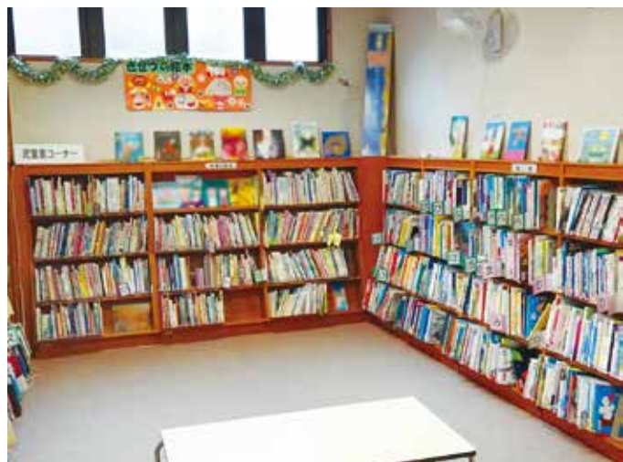
2019.6.7 沼津市立戸田図書館