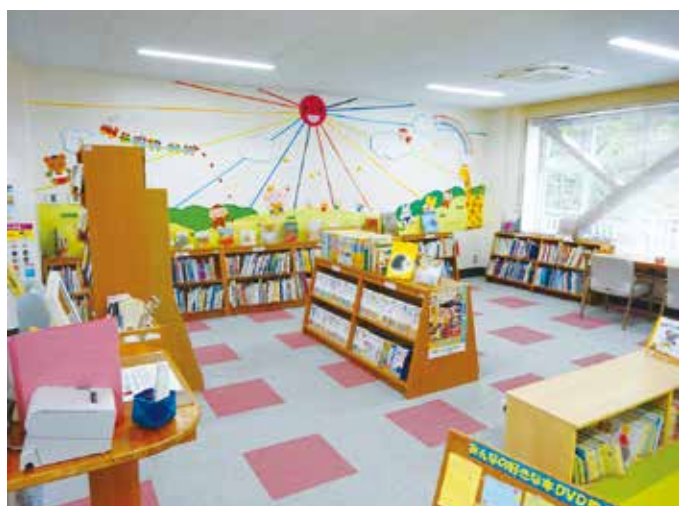
2019.7.5 伊豆市立天城図書館